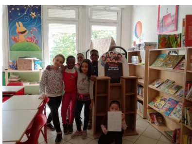
La bibliotechina appena montata